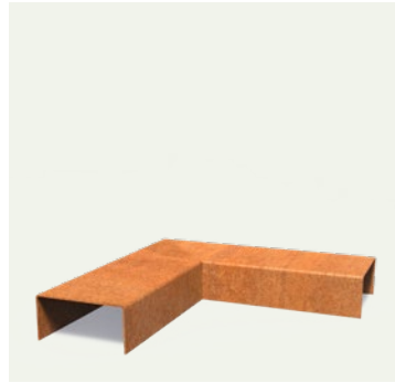
PROFIL ÜBERTRAGEN ECKSTÜCK